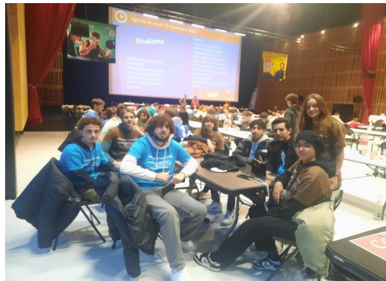
Les deux équipes réunies

Un premier défi devait être relevé par nos deux équipes : celui du challenge communication. Il devait exposer oralement en moins de 3 minutes, leur plan de transition sociale et environnementale pour l'entreprise virtuelle qu'ils représentaient, devant un jury composé de professionnels. Nos étudiants ont dû réfléchir à la stratégie à adopter puis s'exercer pour faire une présentation orale efficace.